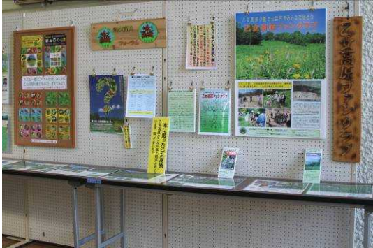
『ようこそ乙女高原へ』展 は市民会館ロビーにて。1月14日からフォーラム当日まで。

山梨市民会館 山梨市万力 1830 TEL 0553-22-9611 国道 140 号線東。万力公園北。 JR 山梨市駅より徒歩 8 分