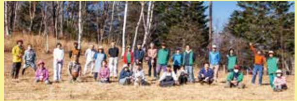
2020年11月の草刈り集合写真(新型コロナのため縮小実施)