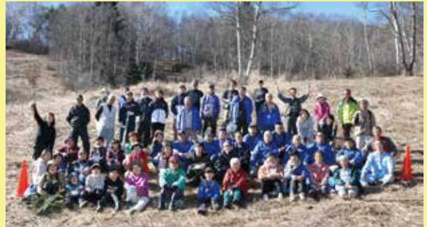
2021年11月の草刈り集合写真(新型コロナのため縮小実施)