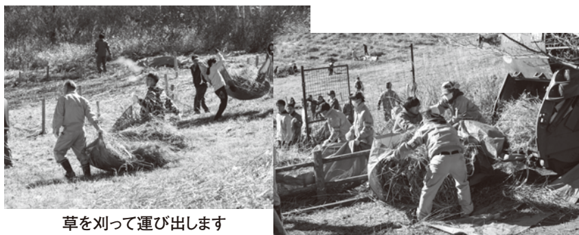
草を刈って運び出します