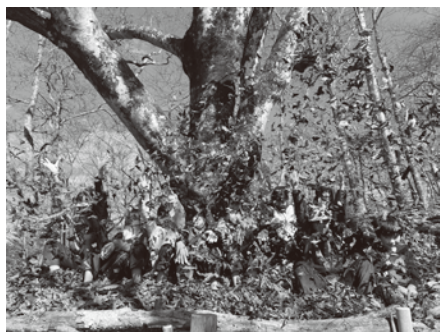
キッズボランティア ブナじいさんに落ち葉のおふとん