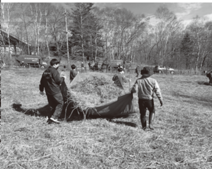
刈った草の運び出し