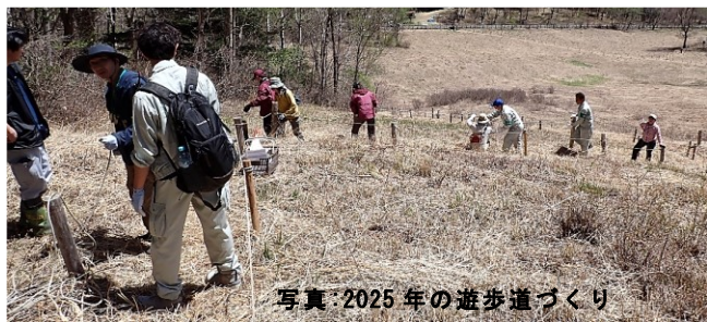
写真：2025年の遊歩道づくり

2026年 5月17日(日) 9:30~12:30 荒天の場合、24日(日)に延期