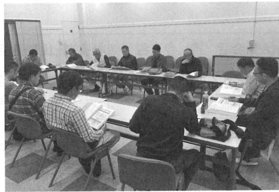
11月に行われたブドウ部の運営委員会の様子から。講習会のあと、今後の活動について夜まで熱心に議論を交わす。部会は陰の地道な努力・熱意に支えられている。(編集)